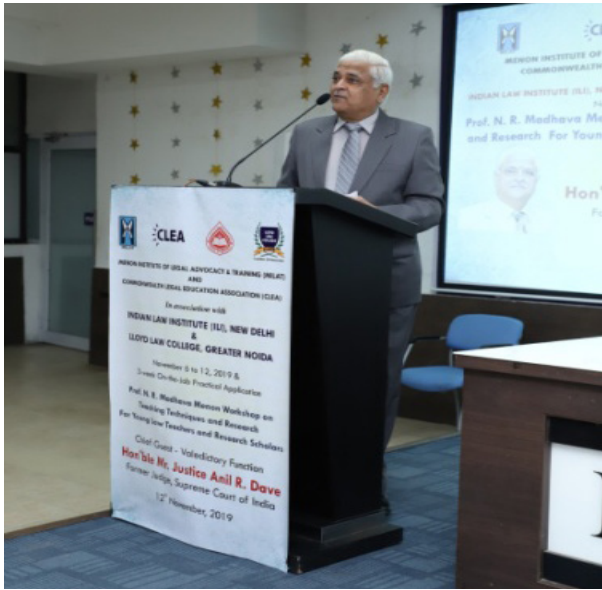
माननीय न्यायमूर्ति अनिल कुमार दवे कार्यशाला के विदाई सत्र में

विदाई समारोह दिनांक 12 नवम्बर, 2019 को लायड लॉ कालेज के सेमिनार हाल में आयोजित किया गया। माननीय न्यायमूर्ति अनिल आर. दवे, भारत के उच्चतम न्यायालय के भूतपूर्व न्यायाधीश मुख्य अतिथि थे। उन्होंने बार, न्यायालय और समस्त समाज के लिए प्रबल, साधन-संपन्न और उत्साही विधिक पेशेवर बनाने में विधि के शिक्षकों और शोधकर्ताओं की कुशलताओं में वृद्धि करने के लिए ऐसी पहल के महत्व को रेखांकित किया।