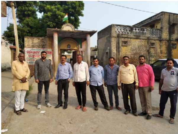
ग्रामीणों के साथ दल के सदस्य