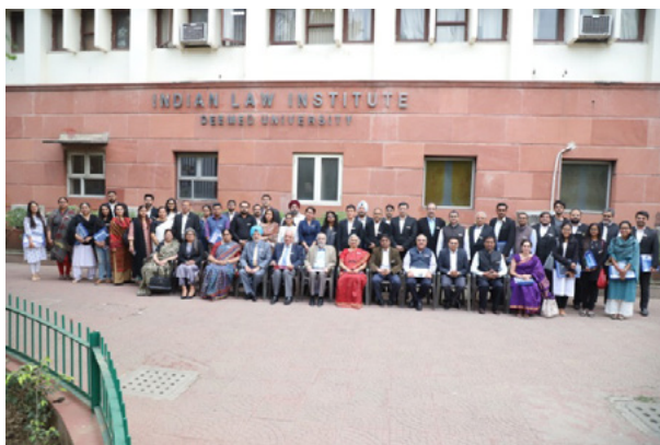
Participants of the programme along with Director & Registrar, ILI

The course was aimed to enable the participants to acquire comprehensive understanding of the concepts of mediation techniques which need to be used keeping in view the requirements of section 89 of CPC and other statutory enactments requiring use of mediation as an effective tool of dispute resolution.