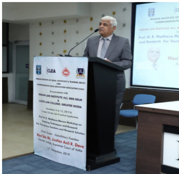
Hon'ble Mr. Justice Anil R. Dave at the valedictory session of the workshop

was an intensive, thoroughly interactive initiative whereby the participants not only shared their experiences, concerns and suggestions, but also came to know about several initiatives of Lloyd Law College like the Legal Aid Services, PIL activities, SAARC moot court competitions, trial advocacy exercises etc. to make teaching and learning actively engaging, effective and socially-relevant for the students.