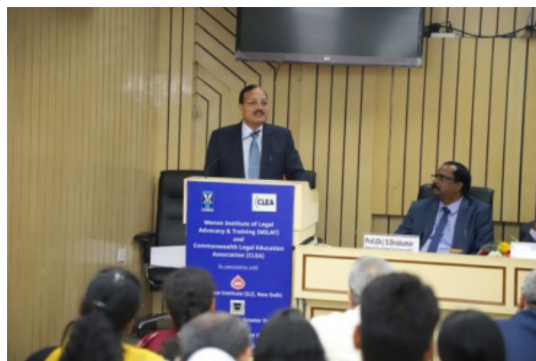
Hon'ble Mr. Justice Surya Kant inaugurated the workshop and delivering the address

The workshop was inaugurated by Hon'ble Mr. Justice Surya Kant, Judge, Supreme Court of India on November 6, 2019 at Indian Law Institute, New Delhi. He shared his valuable experiences and a heartening anecdote from his college days whereby he expressed how profoundly his teachers had impacted his life and what seminal role they had played in moulding his personality. He emphasized on the need of stepping into the profession of teaching only if one is dedicated and truly passionate.