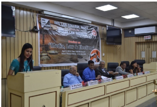
सेमिनार का उद्घाटन सत्र

संस्थान के साथ संयुक्त रूप से पहली बार सेमिनार आयोजित करने की अपनी यात्रा आरंभ की और इस सेमिनार ने न्यायपालिका, भारत के निर्वाचन आयोग, बार, संवाददाताओं और विधि के क्षेत्र के अन्य प्रतिष्ठित व्यक्तियों का, विशिष्ट रूप से आगामी लोक सभा के सदस्यों के राष्ट्रीय निर्वाचन को देखते हुए, जबरदस्त रूप से ध्यान आकृष्ट किया ।