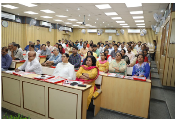
Participants of the consultation programme on child rights