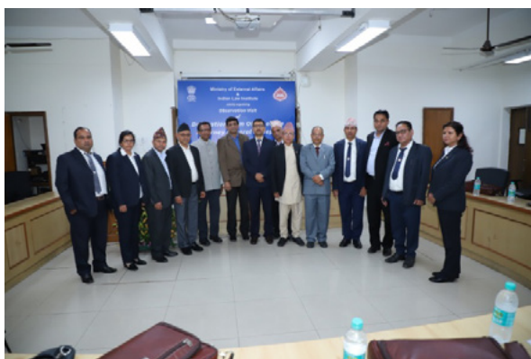
Group photograph of the Delegation with Director, ILI