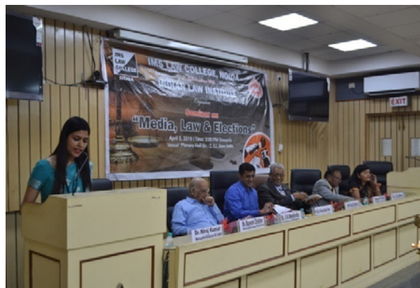
Inaugural session of the seminar

The IMS Law College, Noida ushered in its maiden collaborative voyage of holding the first ever seminar, jointly with the Indian Law Institute and the seminar received an overwhelming attention of judiciary, Election Commission of India, Bar, Journalists and other legal luminaries, particularly in view of the ensuing National Election of the members to the House of People viz. the Lok Sabha.