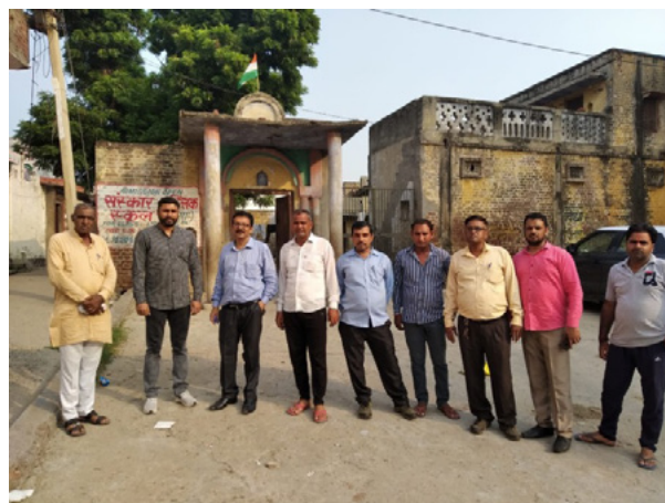
The committee along with the villagers