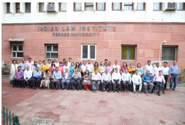
Participants of the training programme