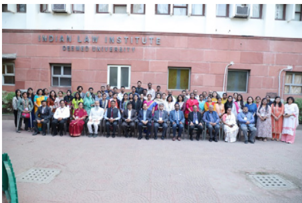
कार्यशाला के प्रतिभागी