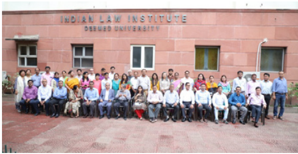
प्रशिक्षण कार्यक्रम के प्रतिभागी