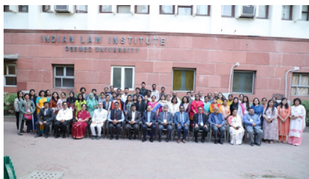
Participants of the workshop