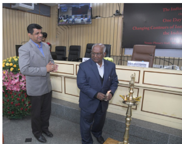
Hon'ble Mr. Justice K.G. Balakrishnan inaugurating the workshop

The Indian Law Institute organised a one day National Conference on “Changing Contours of International Refugee Law and the Indian Position” on February 1, 2020 at the Institute. The seminar extensively discussed various issues pertaining to the plight of refugees from national and international perspectives.