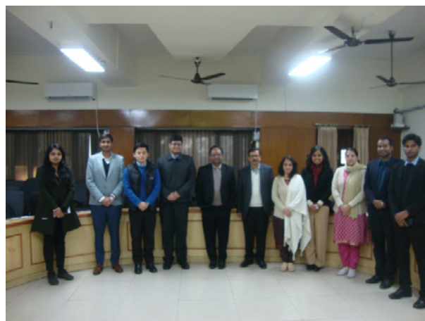
Participants of the training programme