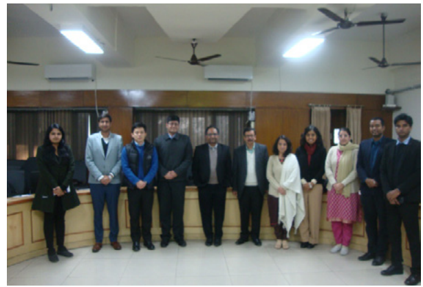
प्रशिक्षण कार्यक्रम के प्रतिभागी