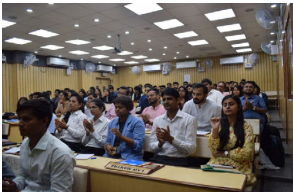
कार्यक्रम में प्रतिभागी

इस सेमिनार का उद्देश्य आनुकल्पिक विवाद समाधान (आल्टरेनेटिव डिस्प्यूट रिजोल्यूशन) की तकनीकियों की व्यावहारिक समझ से और उनके उस समय अत्यधिक महत्व के बारे में छात्रों को सशक्त करना करना था, जब मुकदमों बढ़ते जा रहे हैं और न्यायालय बकाया पड़े मामलों के बोझ का सामना कर रहा है।