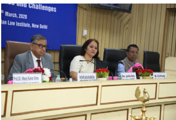
Views from the inaugural session of the training programme

The training programme was inaugurated by Hon'ble Mr. Justice Anirudha Bose, Judge, Supreme Court of India. While delivering the inaugural address, His Lordship highlighted