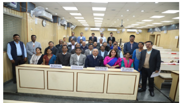
गणमान्य व्यक्तियों के साथ प्रशिक्षण कार्यक्रम के प्रतिभागी

कार्यक्रम के पहले दिन विभिन्न प्रसंगों पर पांच परस्पर संवादात्मक तकनीकी सत्र थे, अर्थात्-