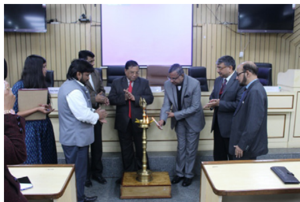
Inaugural session of the seminar

The Indian Law Institute in collaboration with the Law Mantra, Maharashtra National Law University, Nagpur, National Law University and Judicial Academy, Assam organised a One Day International Seminar on “Human Rights and Persons with Disabilities” on January 11, 2020 at the ILI.