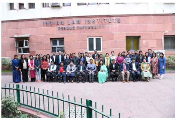
Participants of the training programme along with dignitaries