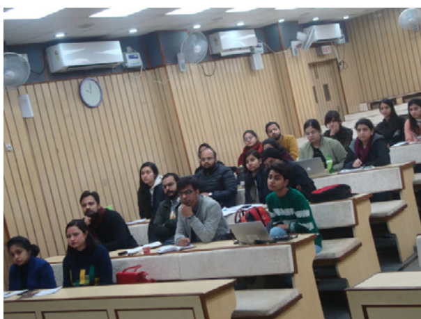
Views from the One day Workshop

The Indian Law Institute organised a One Day Legal Research Methodology Workshop for Ph.D & LLM Students on “Dissertation Writing” on January 28, 2020 at the the Institute. This workshop was organized to give a proper training