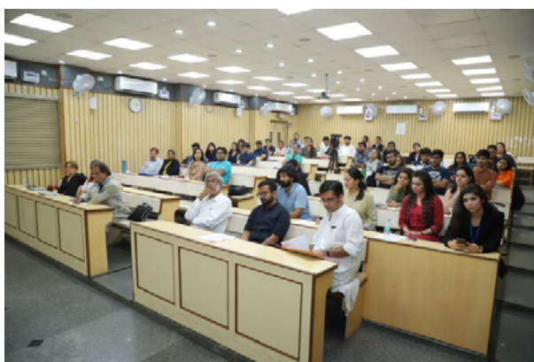
Participants of the certificate course on Business and Human Rights

The course provided an exhaustive introduction to the nature and extent of the human rights responsibilities of business enterprises, how companies could discharge their human rights responsibilities and resolve dilemmas in their day-to-day operations, and various remedial tools available to the victims to seek access to justice in cases involving human rights abuses by business. The seminar-style interactive course was taught, on a pro bono basis, by a team of leading scholars and practitioners.