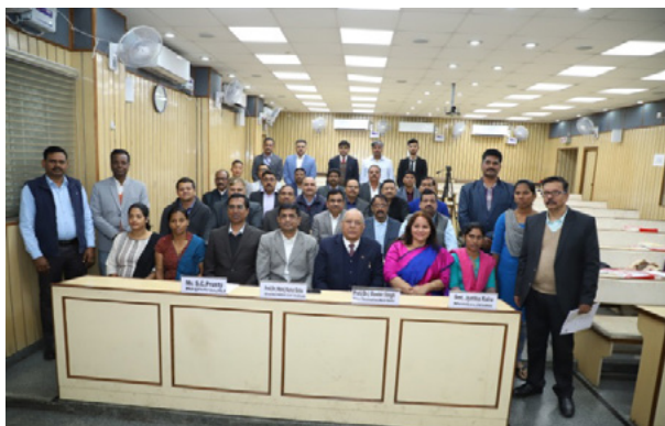
Participants of the training programme along with dignitaries

The first day of the programme consisted of five interactive technical sessions on different themes namely: