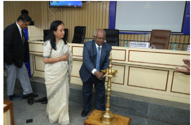
माननीय न्यायमूर्ति के. जी. बालकृष्णन कार्यशाला का शुभारम्भ करते हुए

भारतीय विधि संस्थान ने आत्म-विमोह (आटिजम), प्रमस्तिष्क घात, मानसिक मंदबुद्धि एवं बहुविध निःशक्तताओं से ग्रस्त व्यक्तियों के लिए राष्ट्रीय न्यास के साथ संयुक्त रूप से बौद्धिक और विकास संबंधी निःशक्तताओं से ग्रस्त व्यक्तियों की विधिक समर्थता का निर्माण विषय पर बौद्धिक और विकास संबंधी निःशक्तताओं से ग्रस्त व्यक्तियों से संबंधित मुद्दों पर विचार करने के लिए भारतीय विधि संस्थान के प्लेनरी हाल में दिनांक 23 अक्टूबर, 2019 को एक राष्ट्रीय कार्यशाला का आयोजन किया।