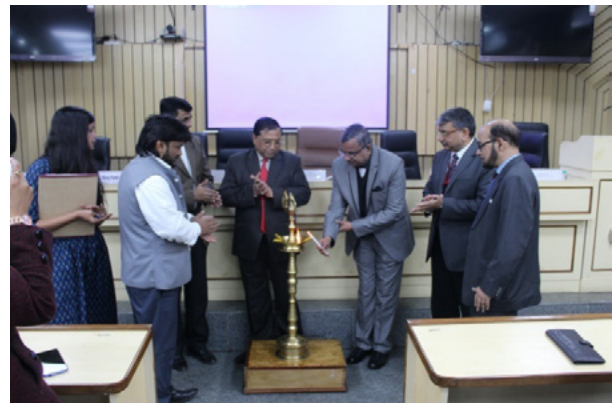
सेमिनार का उद्घाटन सत्र

भारतीय विधि संस्थान ने लॉ मंत्रा, महाराष्ट्र नेशनल लॉ युनिवर्सिटी, नागपुर, नेशनल लॉ युनिवर्सिटी एंड ज्युडिशियल एकेडमी, असम के सहयोग से मानव अधिकार और दिव्यांगजन (ह्यूमन राइट्स एंड पर्सनल्स विद डिसेबिलिटी) विषय पर संस्थान में दिनांक 11 जनवरी, 2020 को एक-दिवसीय अंतरराष्ट्रीय सेमिनार का आयोजन किया ।