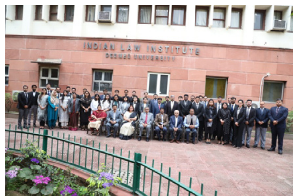
Participants of the training programme along with Director, Faculty of ILI