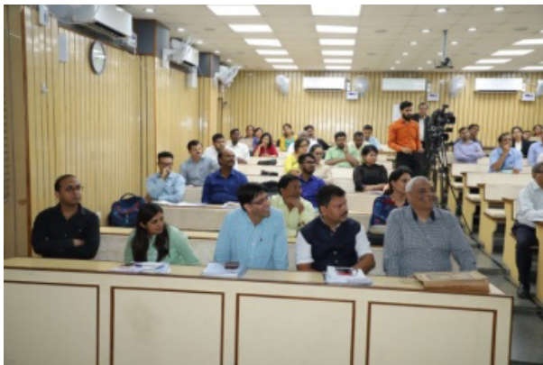
कार्यशाला के प्रतिभागी