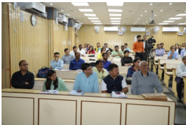
Participants of the workshop