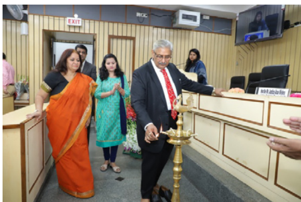
Hon'ble Mr. Justice Arun Mishra inaugurating the training programme

Two Days Training Programme for First Class Judicial Magistrates on “Human Rights: Issues and Challenges” on September 21-22, 2019 at the Institute. Hon’ble Mr. Justice Arun Mishra Judge, Supreme Court of India inaugurated the training programme and presided over the function. While delivering the inaugural address His Lordship emphasised on the important issues and Challenges of the Human Rights.