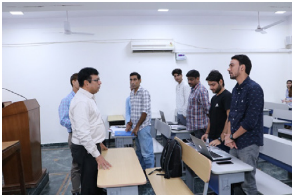
UGC Inspection team interacting with the ILI students