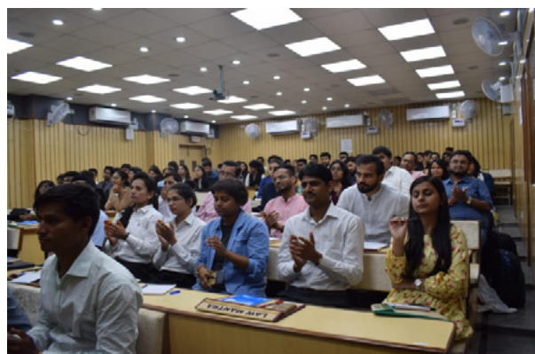
Participants at the programme.

The objectives of the seminar was to empower students with the practical understanding of Alternative Dispute Resolution (ADR) techniques and its immense significance at a time when law suits are increasing and courts are facing a vast backlog of cases.