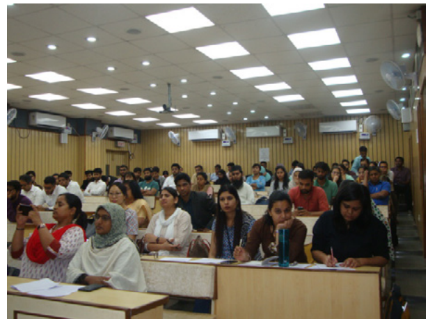
कार्यक्रम में प्रतिभागी