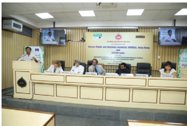
Inaugural session of the conference on 'Business and Human Rights'