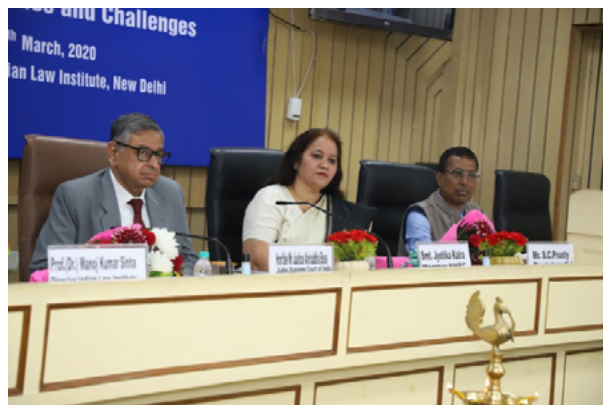
प्रशिक्षण कार्यक्रम के उद्घाटन सत्र के दृश्य