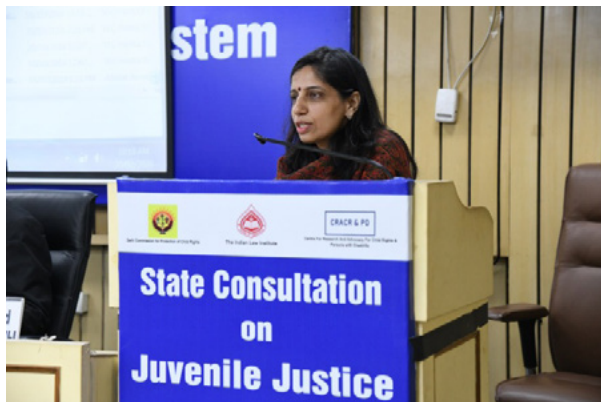
Views from the One day Consultation for Juvenile Justice Stakeholders in Delhi

One Day Workshop on “MOOCS: Design, Development and Deliver (February 19, 2020)