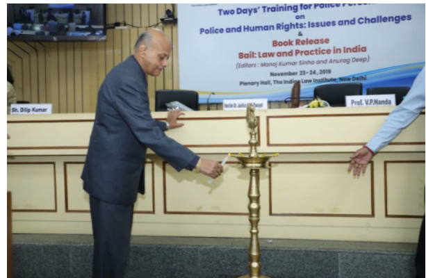
माननीय न्यायमूर्ति (डा.) अरिजीत पसायत दीप प्रज्ज्वलित करके कार्यक्रम का शुभारम्भ करते हुए

भारतीय विधि संस्थान ने राष्ट्रीय मानवाधिकार आयोग के सहयोग से दिनांक 23-24 नवम्बर, 2019 को संस्थान के प्लेनरी हाल में “पुलिस और मानवाधिकार: मुद्दे और चुनौतियां (पुलिस एंड ह्यूमन राइट्स: इसूज एंड चैलेंजिज)” विषय पर पुलिस क्रमियों के लिए दो दिवसीय प्रशिक्षण कार्यक्रम का आयोजन किया।