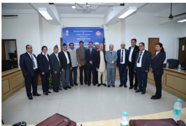
निदेशक, भारतीय विधि संस्थान के साथ समूह फोटोग्राफ