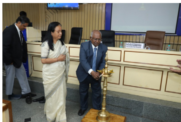
Hon'ble Mr. Justice K.G. Balakrishnan inaugurating the workshop