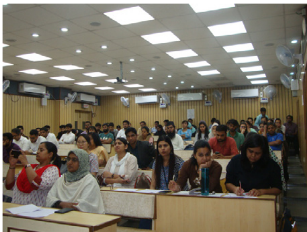
Participants of the Workshop